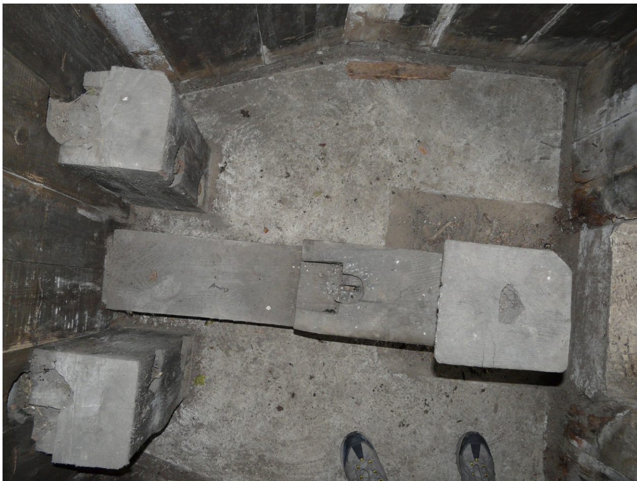
Rama drewniana - widok od góry. Egzemplarz zachowany na forcie VI w Poznaniu